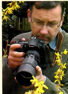
Jean-Christophe Vincent PHOTOGRAPHE PRO

Macrophotographe passionné, Jean-Christophe Vincent s'est fait connaître pour ses images d'insectes. Mais il cultive bien d'autres talents dans son jardin secret. Ce guide pratique et poétique sur la photo de fleurs en est la preuve.